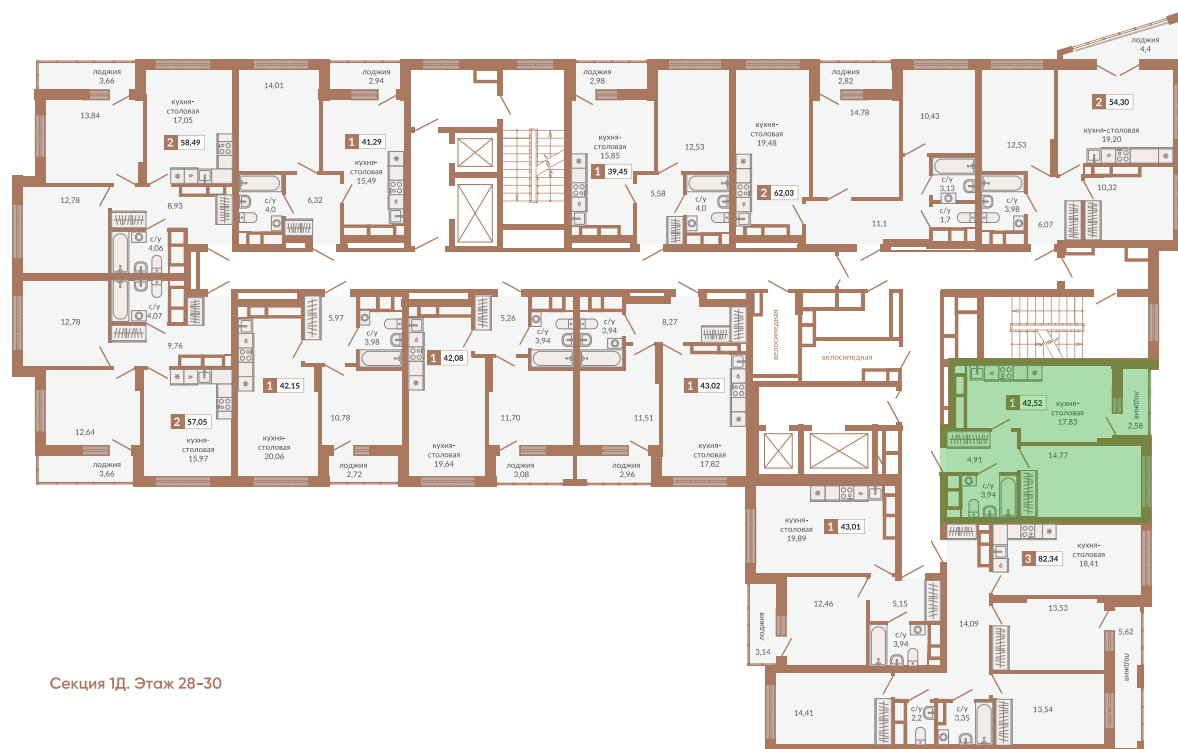
Секция 1Д. Этаж 28-30