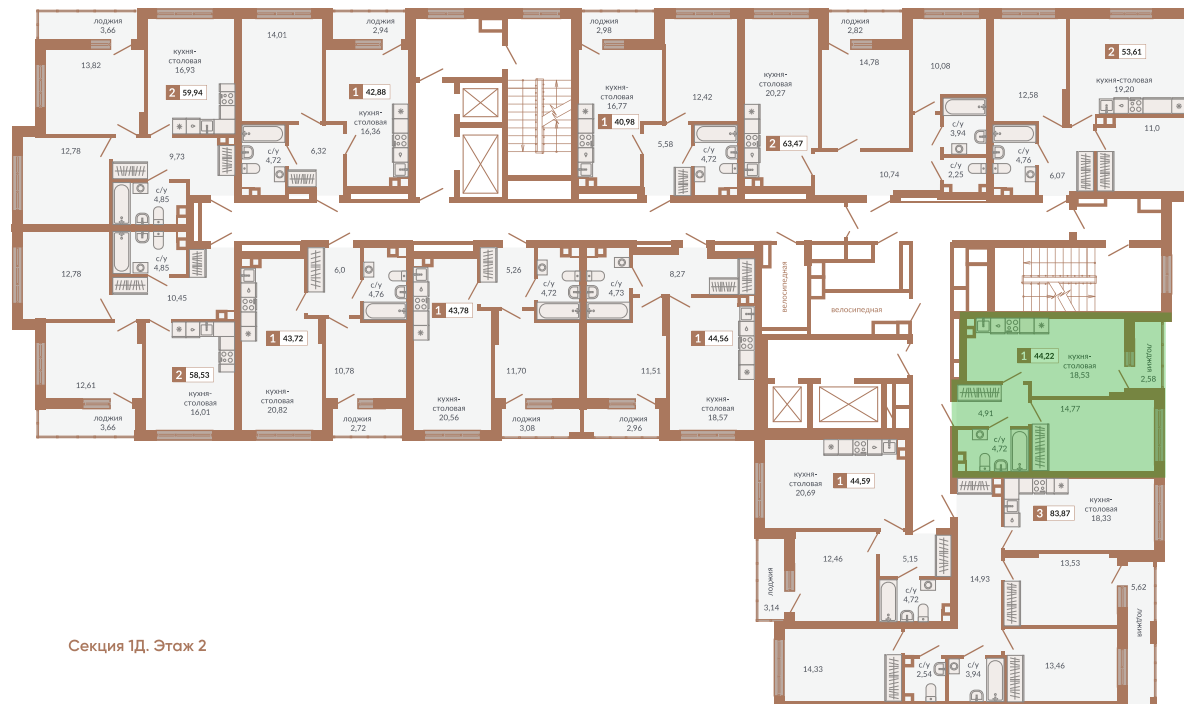
Секция 1Д. Этаж 2